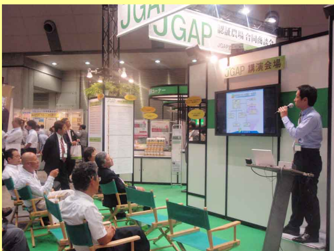
農事組合法人 和郷園様