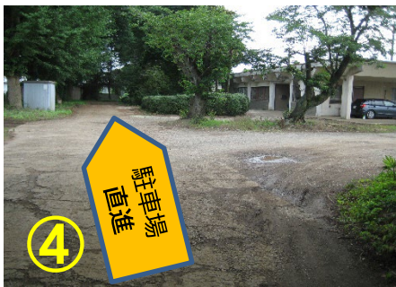
④ 右側に見える建物が事務所です 駐車場へはそのまま直進します