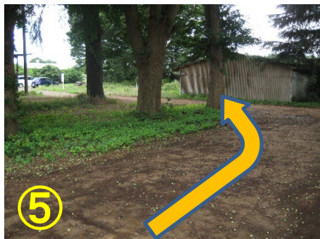
⑤ 駐車場は突き当りを左に曲がった右側にあります 手前から詰めて駐車してください (写真⑤)