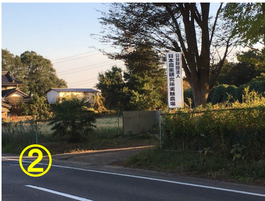
② 入り口が見えてきました 右折時、道路の横断時にご注意下さい (入り口写真B)