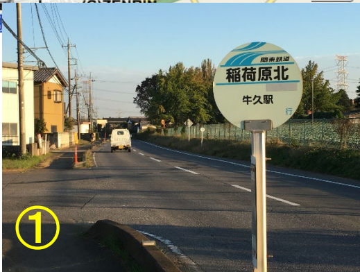
① 稲荷原北バス停で降車下さい。一つ手前のバス停は明神前で道路の向かいに農場が見えます