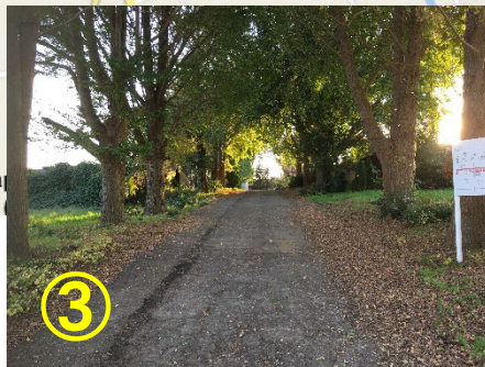
③ イチョウ並木を直進します