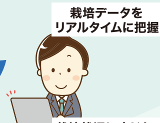
栽培データを リアルタイムに把握