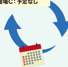
散布実績/進捗の確認 適否判定