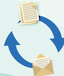
生産者へ情報を 一斉配信