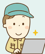
日々の記録が 提出書類に