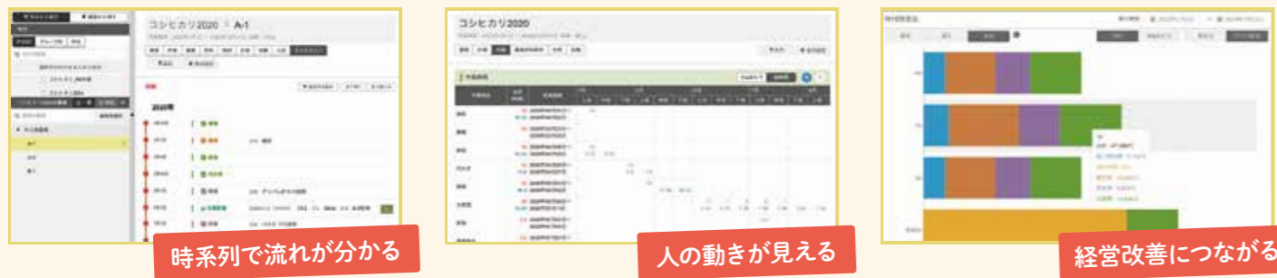
時系列で流れが分かる

圃場や記録のデータは農場の資産となり、課題の解決からノウハウの継承まで幅広く活用できます。