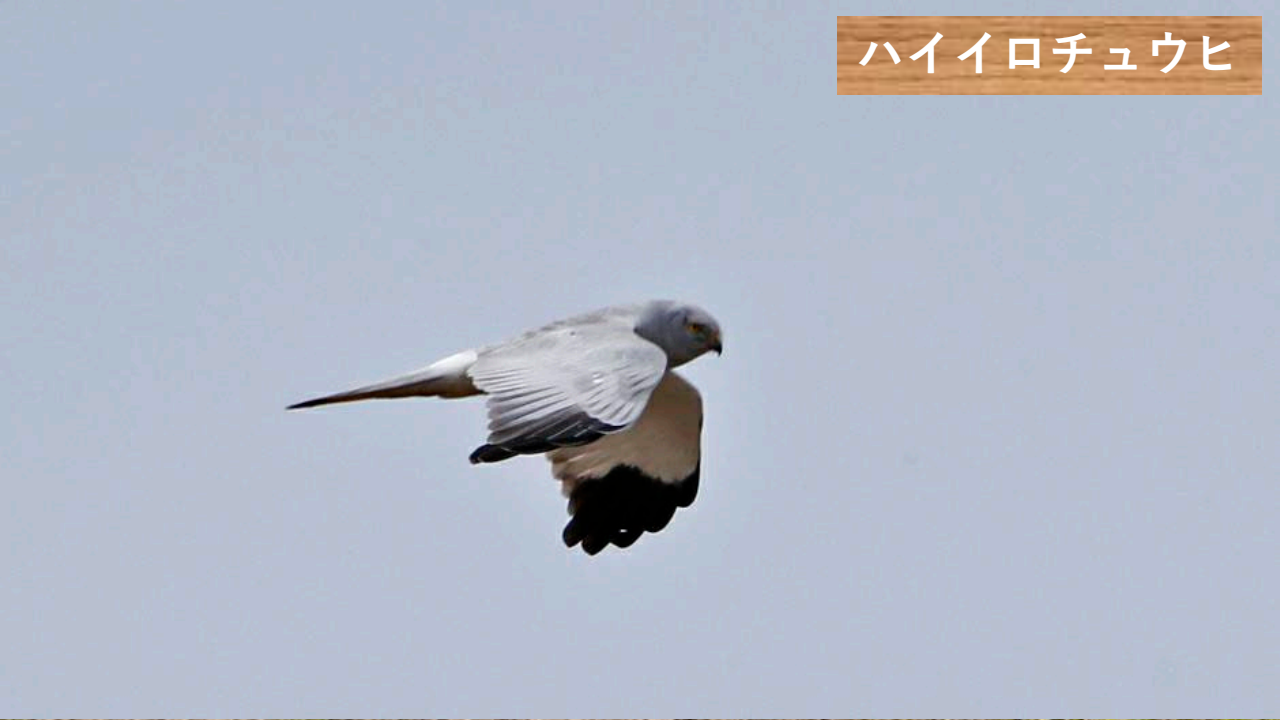
ハイイロチュウヒ