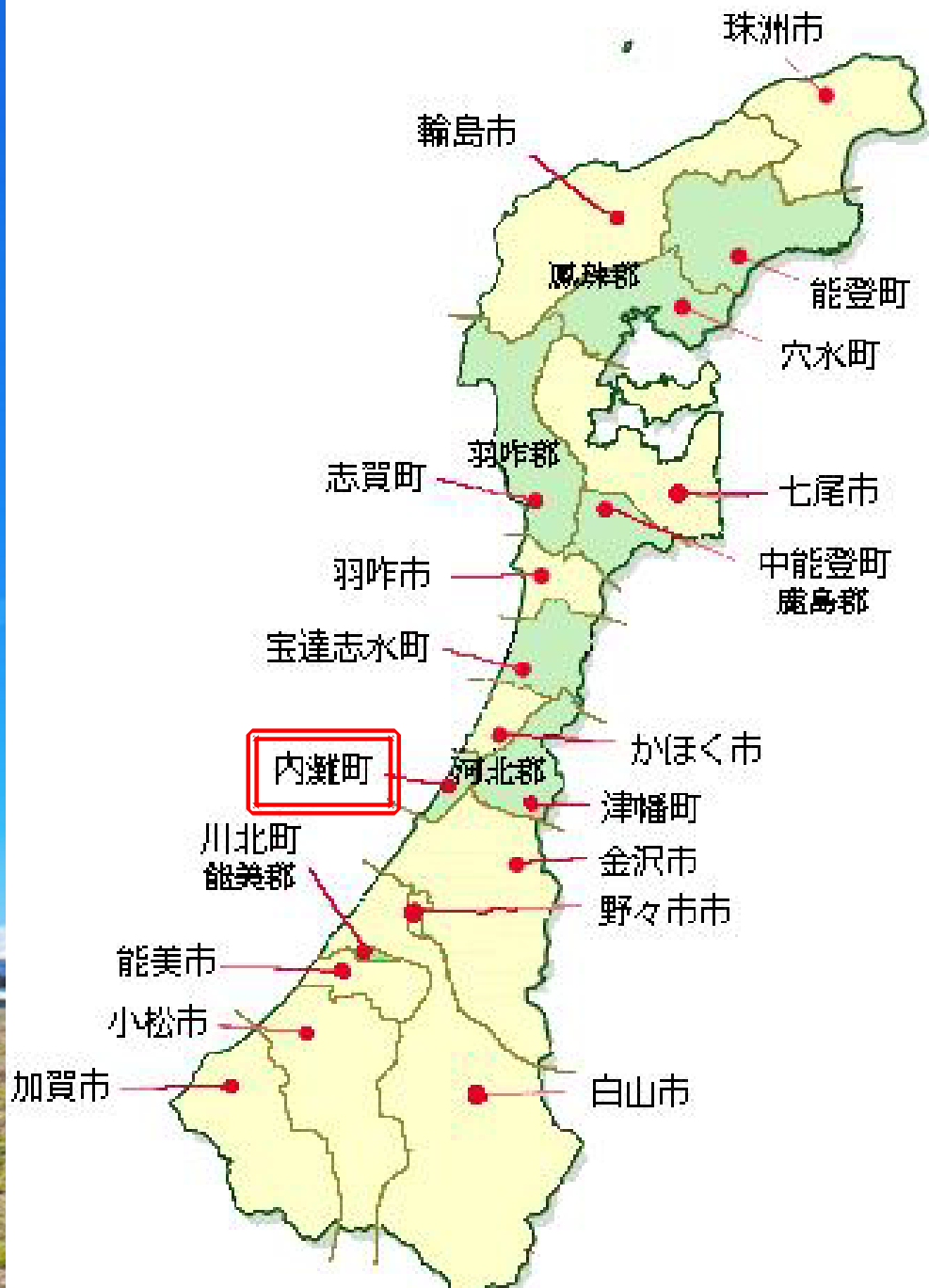
画像：こども向け県庁ガイド「石川県のすがた」より抜粋、一部加工