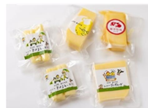
藤井牧場の牛乳「北海道富良野牛乳」とチーズ