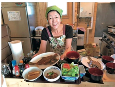
不規則になりがちな社員の健康を考え、1食200円でバランスのとれた食事を食べられる社員食堂。20代前半の若い社員が多いこともあり、好評とのこと。

牛も人もどンドン育てる牧場のコンセプトが従業員の皆さんにもしっかり届いているようです。