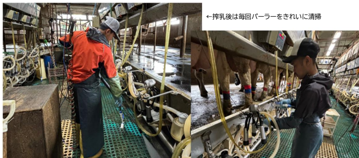
←搾乳後は毎回パーラーをきれいに清掃

うするか、もっと牛を丁寧に扱うにはどうするか、もっと衛生的にするにはどうするかなど、従業員から改善の提案が出てくることは多く、その中で、生産工程と管理点とを照合しながら率先して改善していく姿勢がみられるそうです。