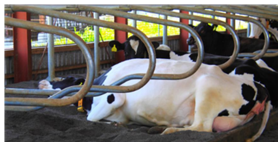
砂のベッドで気持ちよさそう！

さらには、成長支援制度を用いて 1 年に 4 回、必要な知識技術の習得などについてミーティングを開催し、しっかりと従業員の成長の支援を行ったり、自主流通を行い、牛乳のブランド化、チーズの商品開発も進めています。