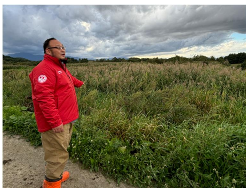
牛の排泄物やパーラー排水等を処理するための浄化湿地。なんと東京ドーム100個分以上の面積。