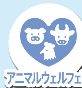
アニマルウェルフェア