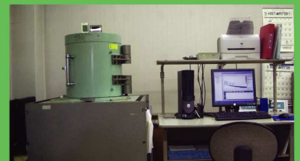
Ge半導体分析装置またはシンチレーションスペクトロメータを使用

*国の基準値よりも低い独自基準を設定してプログラムを実施することも可能です。日本GAP協会までご相談ください。