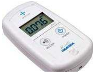
環境放射線モニタ

◆これからはじめられる方向けのセットとなります。放射能簡易測定に必要な機材をまとめたセットです。環境放射線モニタ（ラディ：PA-1000）をお持ちでない方は、本セットをお勧め致します。