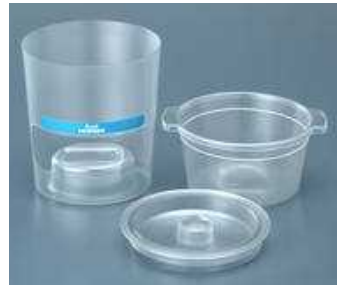
PA-1000 用放射能簡易測定キット